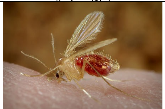
Sandmücke ( Phlebotomus papatasi ) bei der Blutmahlzeit