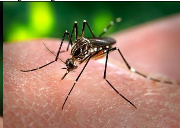
Gelbfiebermücke ( Aedes aegypti oder Stegomyia aegypti )